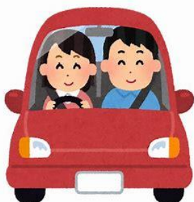
住宅側へ前向き駐車