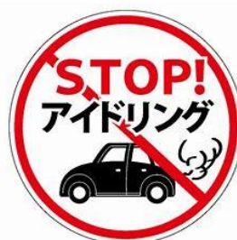
駐車時はエンジン停止