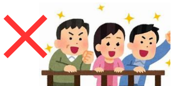
道路からの観戦禁止

花野井散歩道及び公道からの観戦はお控えください。必ず TEG フィールド敷地内からお願いします。