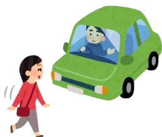
ゆずり合いと安全運転