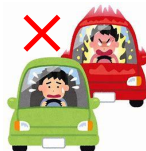
やめよう！イライラ運転