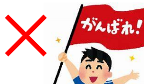
応援・観戦はお静かに